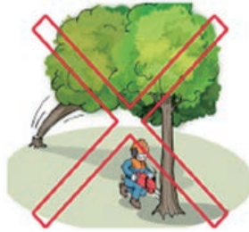
[ 받치고 있는 나무 벌목 금지 ]

⑤ ‘걸려 있는 나무를 받치고 있는 나무’를 벌목하거나 걸린 나무 밑에서 작업 금지