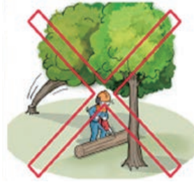
[ 걸린 나무 아래 작업 금지 ]