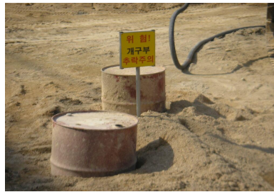
<그림 9> 천공 후 개구부 식별 및 덮개설치