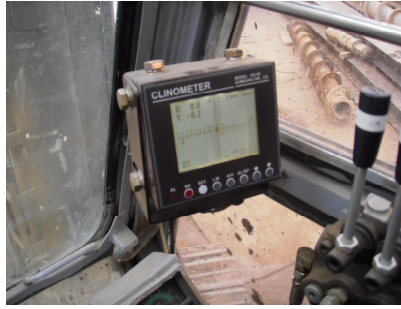
<그림 1> 리더 경사 각도계