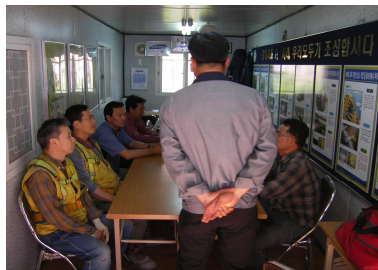
<그림 5> 작업 전 근로자 교육

(나) 관리감독자는 작업 전에 근로자에게 위험요인과 이에 대한 대응 방법 등에 대하여 교육을 실시하여야 한다.