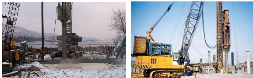
<그림 11> 파일 항타 작업

① 항타용 해머(Hammer) 인양 시 하부에 근로자의 출입을 통제하여야 한다.