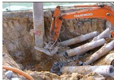
<그림 12> 두부 정리 작업

③ 강선 절단 시 비산 및 찢림 등에 의한 재해 예방 조치를 취하고, 근로자는 보안면(경)과 같은 안면보호구와 보호 장갑을 착용하여야 한다.