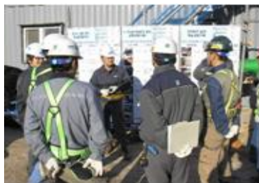
<그림 6> TBM(Tool Box Meeting) 등 위험예지활동

(다) 작업 전 근로자가 지켜야 할 사항에 대하여 위험예지활동을 실시하여야 한다.