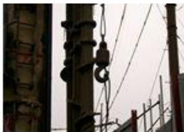
<그림 10> 파일 인양작업