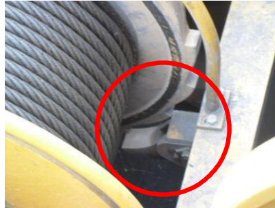
<그림 4> 역회전방지 브레이크