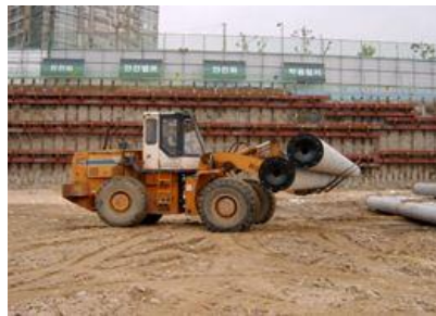
<그림 7> 장비를 이용한 파일운반

① 지게차 등 장비를 이용한 운반 시에는 급제동 및 급전환을 금지하고, 주변 장애물과 충돌 등을 예방하여야 한다. 그 밖의 지게차 이용 작업과 관련한 안전수칙은 지게차의 안전운행에 관한 기술지침 (KOSHA GUIDIE G-31-2011)을 따른다.