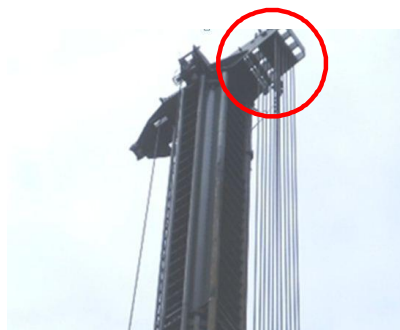
<그림 3> 권과방지장치