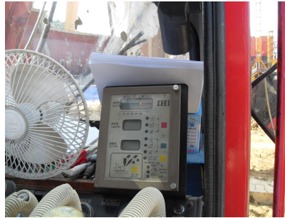
<그림 2> 오거 인발 하중계