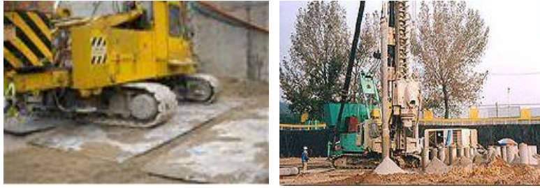
<그림 8> 천공 작업