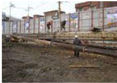
<그림 13> 장비 해체