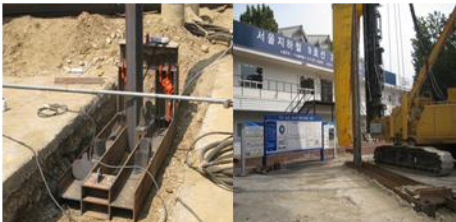
<그림 6> 기준틀 시공전경