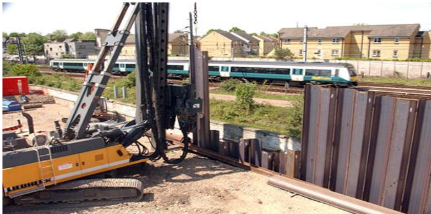
<그림 12> 강널말뚝의 인발작업