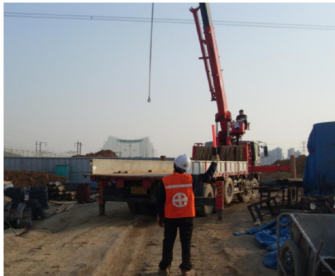
<그림 8> 크레인 인양작업시 신호수 배치