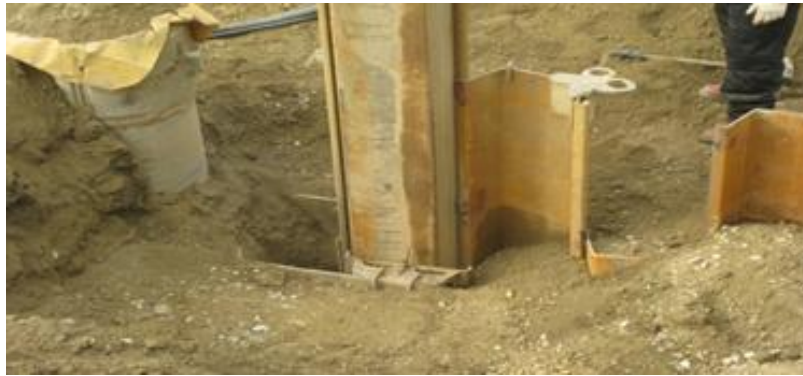
<그림 7> 강널말뚝 세우기