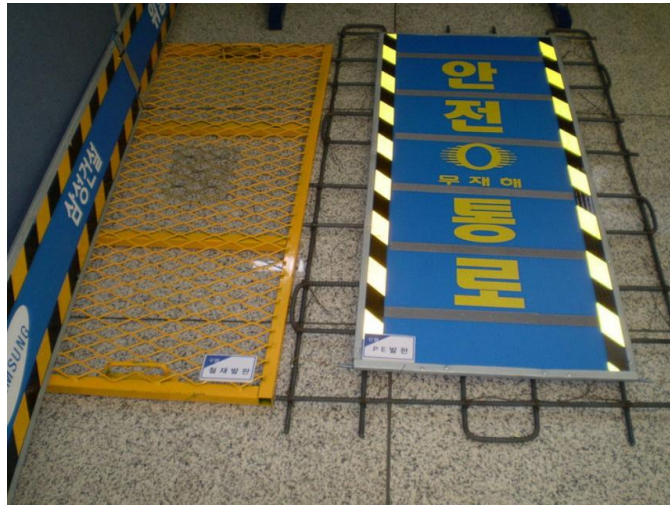
<그림 2> 흙막이 공사를 위한 안전 시설물