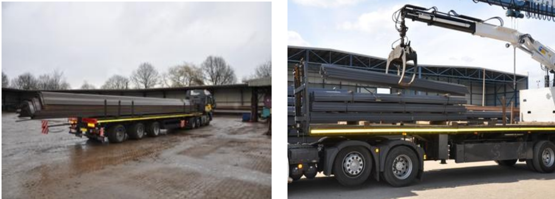
<그림 4> 강널말뚝의 운반과정