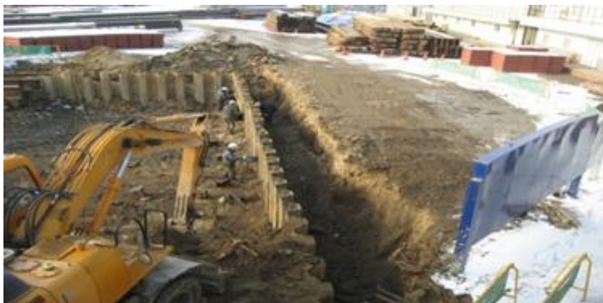
<그림 11> 강널말뚝의 설치완료