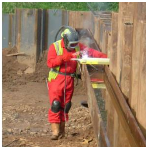
<그림 10> 강널말뚝 이음에서의 용접과정