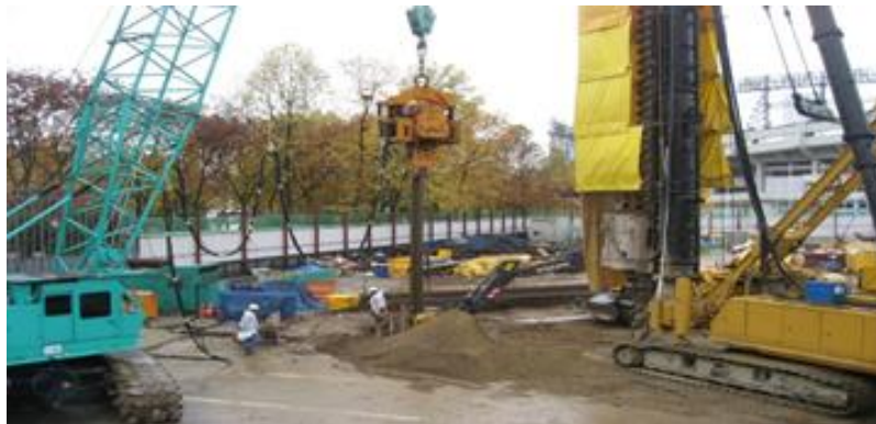
<그림 9> 강널말뚝 박기