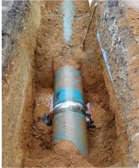
<그림 3> 줄파기로 인한 지장물 노출