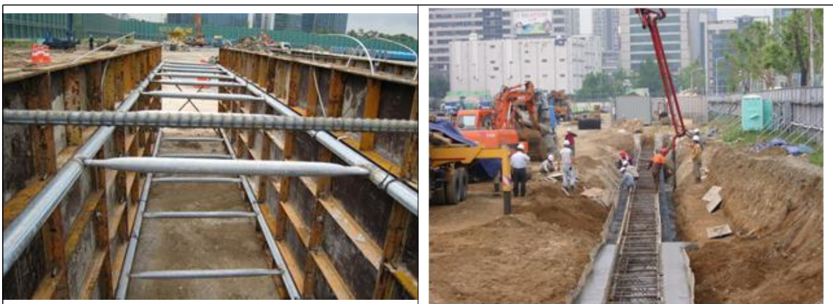
<그림 8> 안내벽의 거푸집 설치 및 콘크리트 타설 전경