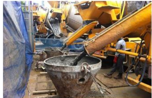
&lt;그림 7&gt; 공정별 시공 전경