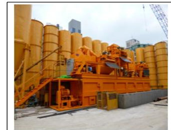
<그림 4> 플랜트 전경