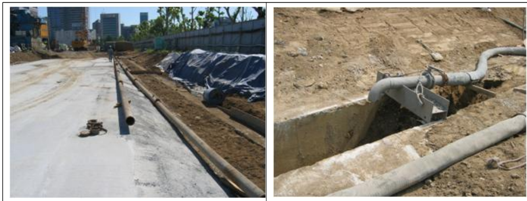
<그림 10> 안정액 배관 설치 전경