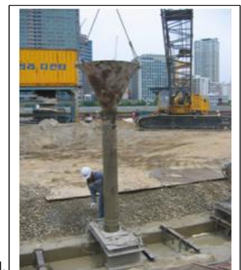
<그림 5> 트레미관