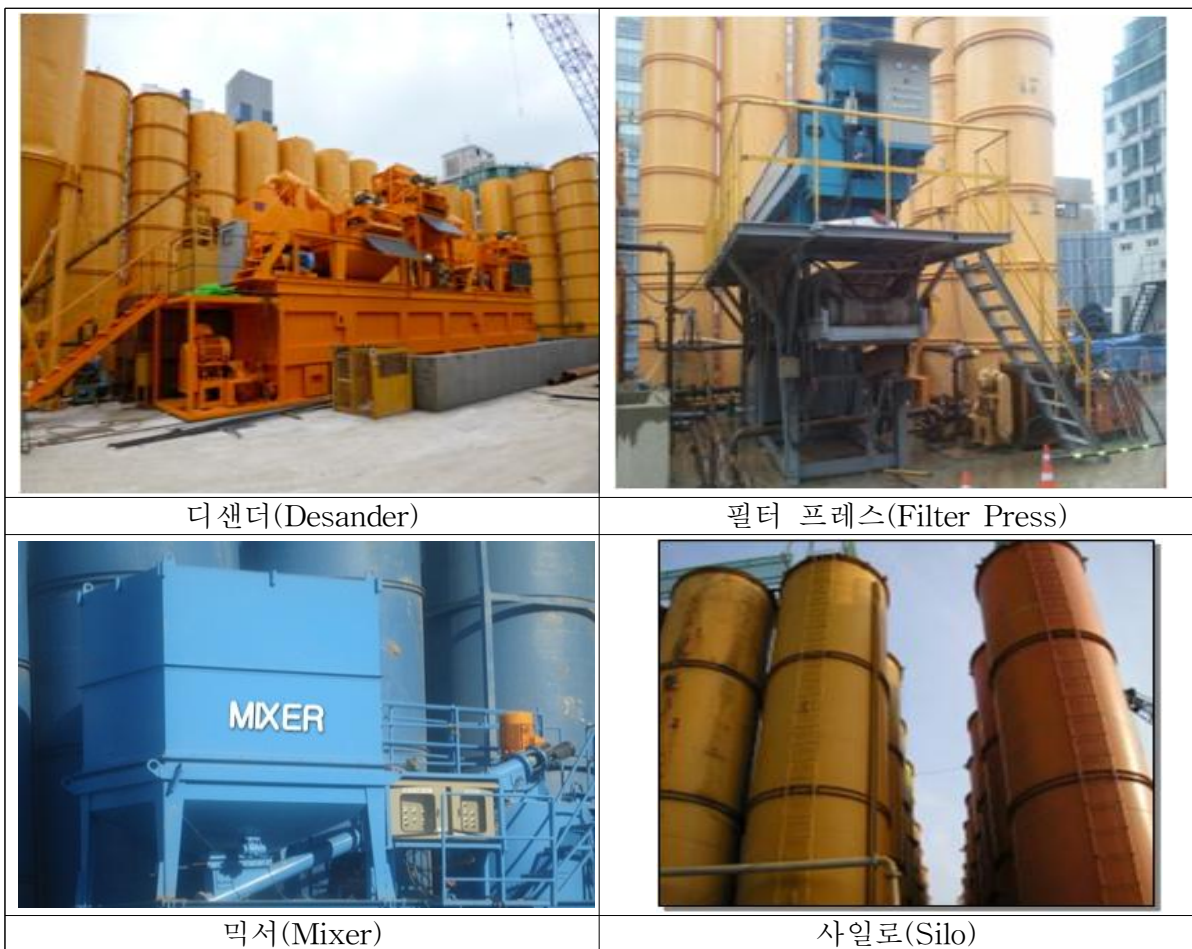
<그림 9> 플랜트를 구성하는 주요 장비