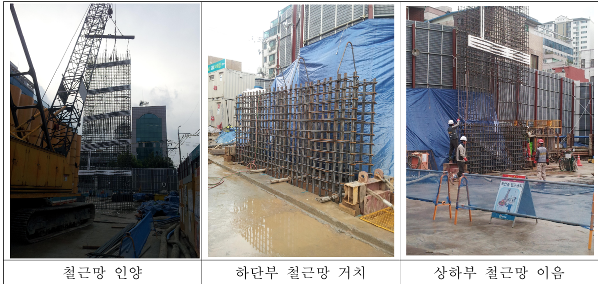
<그림 13> 철근망의 삽입 절차