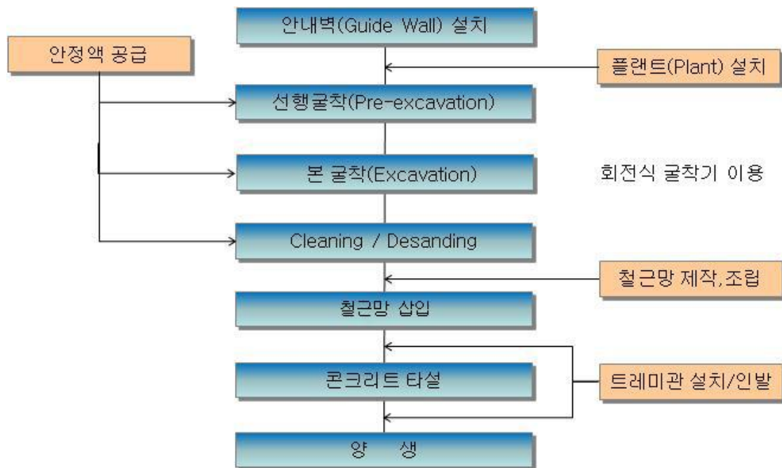
<그림 6> 지하연속벽 공법의 시공순서

지하연속벽 공법의 시공순서는 <그림 6>과 같으며 각 공정별 시공사진은 <그림 7>과 같다.