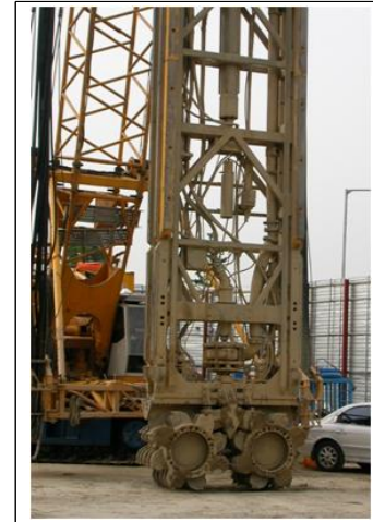
<그림 3> 트렌치 커터