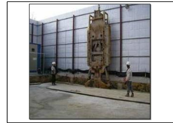
<그림 2> 선행굴착 전경

(2) 기타 이 지침에서 사용하는 용어의 정의는 특별한 규정이 있는 경우를 제외하고는 산업안전보건법, 같은법 시행령, 같은법 시행규칙, 산업안전보건기준에 관한 규칙에서 정하는 바에 의한다.