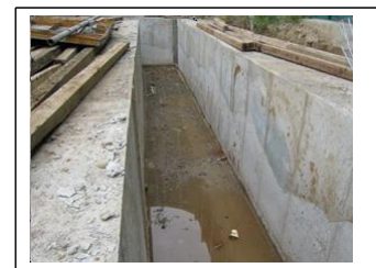
<그림 1> 안내벽 전경

(가) “안내벽(Guide Wall)”이라 함은 지하연속벽을 만들기 위해 그 양측에 설치하여 굴착시 충격에 의해 표토층이 무너지는 것을 방지하고 철근망 및 트레미관 삽입시 받침대 역할을 하는 철근콘크리트 벽체구조물을 말하며 보통 1,200~1,500mm 깊이로 설치한다.